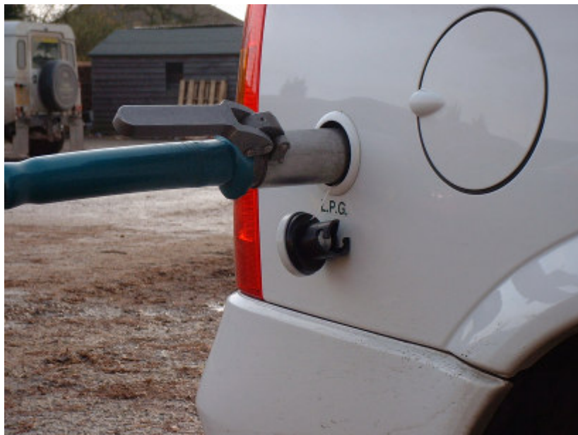
Repostaje de GLP

Los vehículos a GLP son similares a sus equivalentes de gasolina pero difieren en los sistemas de almacenamiento y alimentación de combustible al motor. La mayoría de los conductores no notarían la diferencia entre un coche que funcione con gasolina y otro que lo haga con GLP. El GLP es un gas en condiciones normales de presión, pero se licua al someterlo a una presión relativamente baja (unos 10 bares). El almacenamiento del GLP en los vehículos se hace en estado líquido, aunque su combustión en el motor se realiza en estado gaseoso.