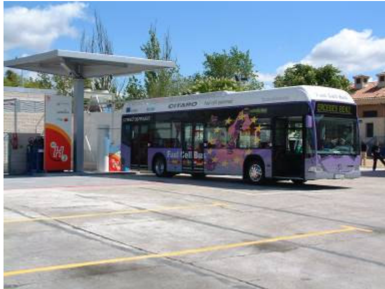
Autobús de pila de combustible del proyecto Citycell(Madrid)