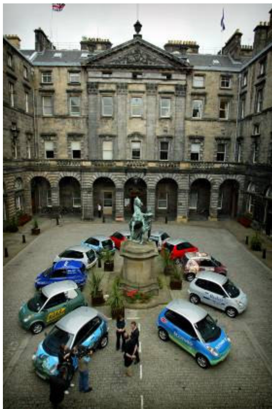
Plataforma de vehículos eléctricos en Edimburgo

Los vehículos eléctricos se agrupan en dos clases: los totalmente eléctricos, que a su vez se dividen entre los que son alimentados únicamente por baterías, los que aprovechan la energía solar, y los que utilizan pilas de combustible; y por otro lado los vehículos híbridos. En este capítulo sólo vamos a estudiar los vehículos eléctricos alimentados exclusivamente por baterías, pues del resto ya existe en este manual un capítulo propio para cada uno, salvo para los vehículos eléctricos solares.