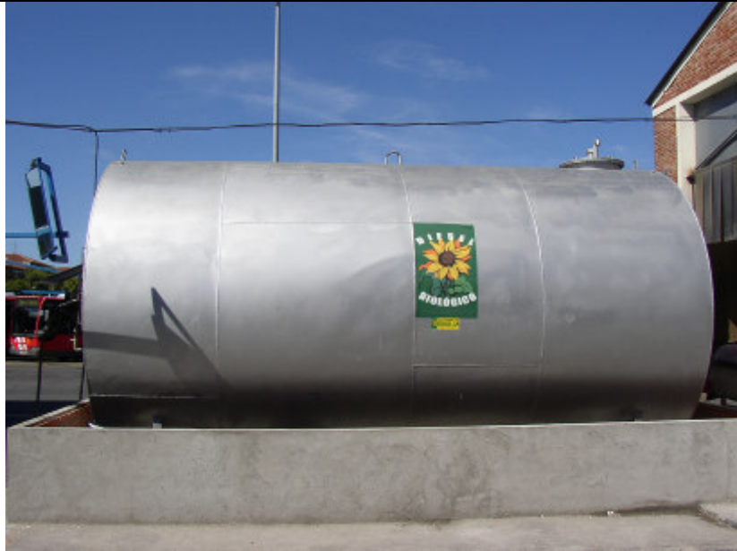
Tanque de biodiésel

En España, las principales materias primas para la fabricación de biodiésel son los aceites usados, la colza y el girasol.