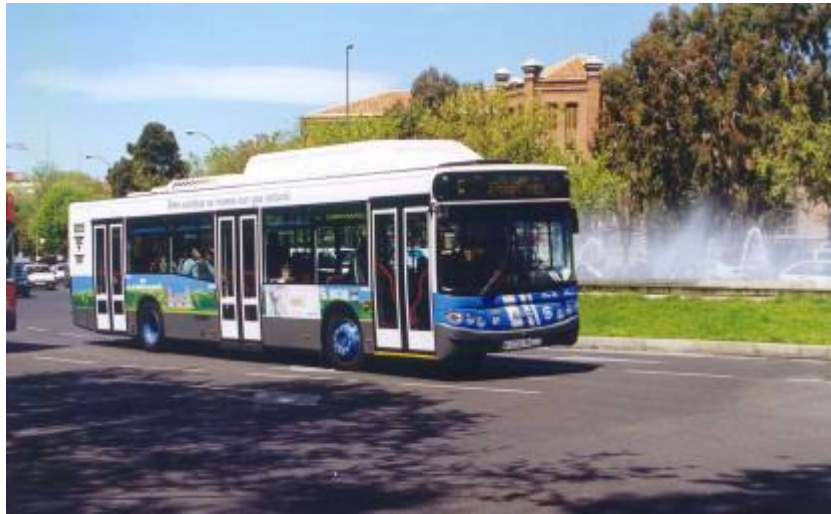
Autobús urbano a gas natural en Madrid

Previsiblemente, en un futuro próximo el número de vehículos a GNC se verá incrementado en 361 unidades más, debido a los planes existentes de ampliación de flotas de autobuses a gas natural de varias ciudades.