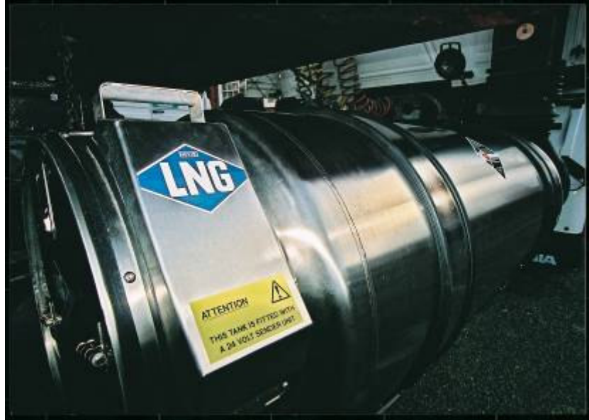
Tanque de GNL

Los VGN monocombustible están optimizados para funcionar con GN, lo que implica mejores rendimientos y emisiones inferiores de gases contaminantes.